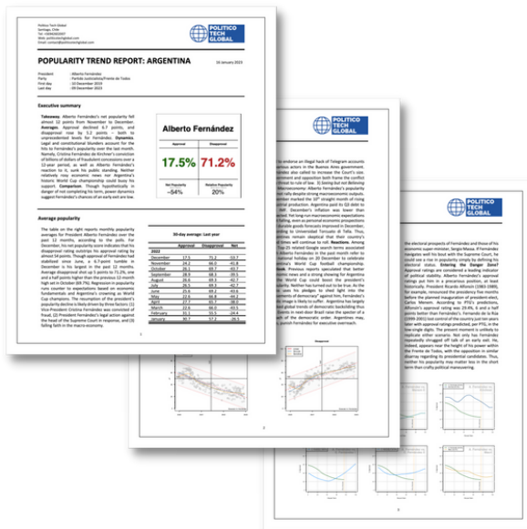
Reporte de tendencia